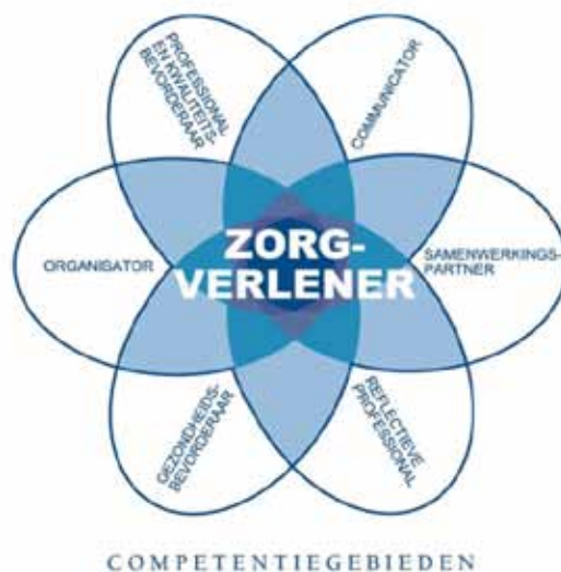
Figuur 1. CanMEDS-systematiek

Zoals in de inleiding van dit document naar voren kwam moet het Expertisegebied justitieel verpleegkundige beschouwd worden als een verdieping van en aanvulling op het Beroepsprofiel verpleegkundige (Lambregts & Grotendorst, 2012). Het Beroepsprofiel beschrijft de elementen van het beroep die voor elke verpleegkundige van toepassing zijn en ook voor de verpleegkundigen die onder een Expertisegebied vallen. Om de verbinding tussen het Beroepsprofiel en het Expertisegebied te verhelderen, komen de kennis en vaardigheden uit het Beroepsprofiel terug in het Expertisegebied. Vervolgens worden vanuit deze basis de aanvullende kennis en vaardigheden van de justitieel verpleegkundige beschreven. Dit alles wordt uitgewerkt aan de hand van de CanMEDS-systematiek (Canadian Medical Education Directions for Specialist). Deze systematiek bestaat uit zeven verschillende rollen. De kern van de beroepsuitoefening is de verpleegkundige als zorgverlener. Alle andere rollen raken staan in het teken van deze centrale rol. De rol van zorgverlener geeft richting aan de andere CanMEDS-rollen.