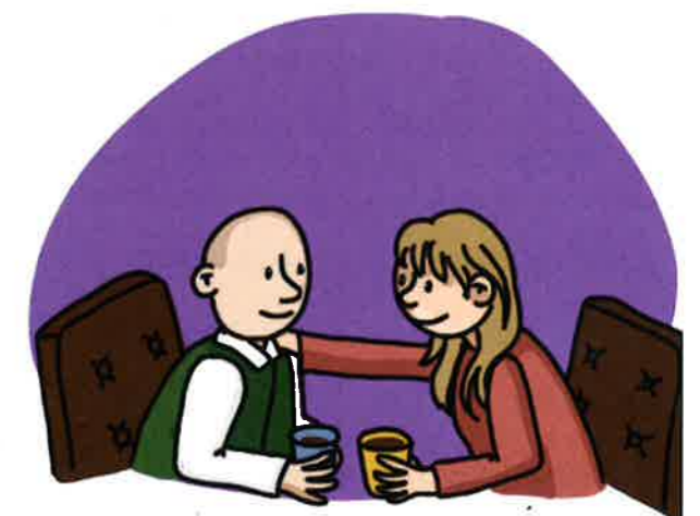
Er zijn voor de ander

gelijkwaardige relatie tussen cliënt en begeleider via vier kernhandelingen: verbinden, verstaan, verzekeren en versterken . In een speciaal ontwikkeld boekje worden de tools gekoppeld aan deze kernprincipes. Door aandacht te besteden aan de wensen, behoeften en mogelijkheden van de cliënt en diens naasten, wordt gestreefd naar een betere kwaliteit van leven. Het werken aan sociale inclusie en het versterken van sociaal gewaardeerde rollen is een belangrijk