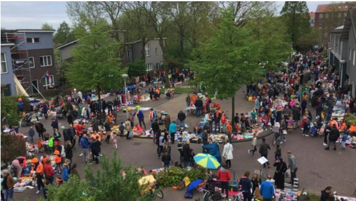
Koningsdag bij 't Groene Sticht 2018