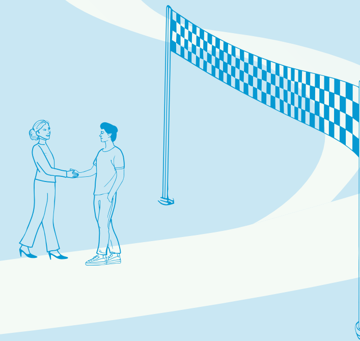
Zekerheid boven verkorte looptijd