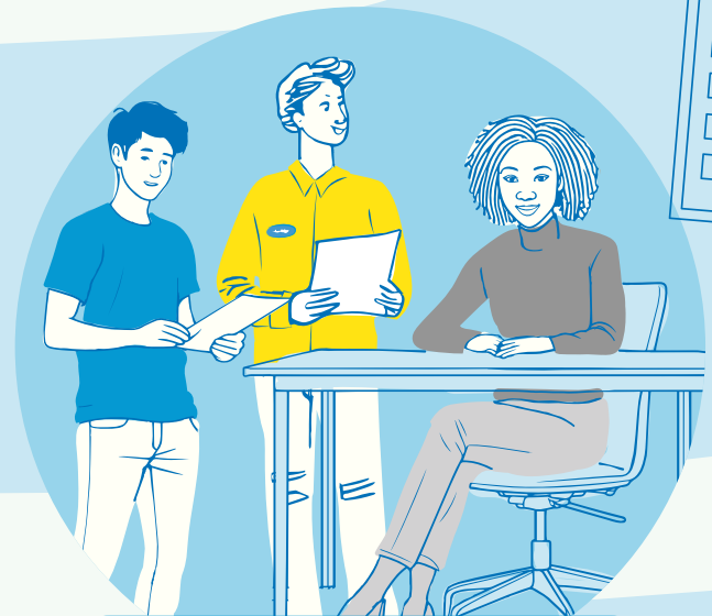
Minder hoge eisen