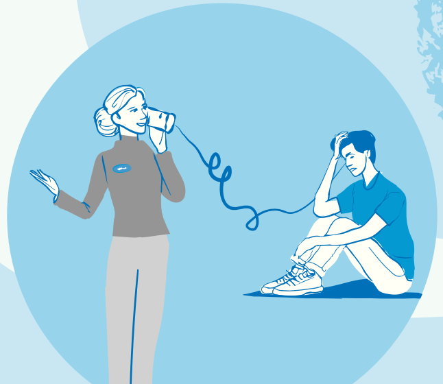
Goede bereikbaarheid en check-ins