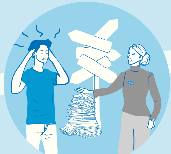
Duidelijkheid en begrip