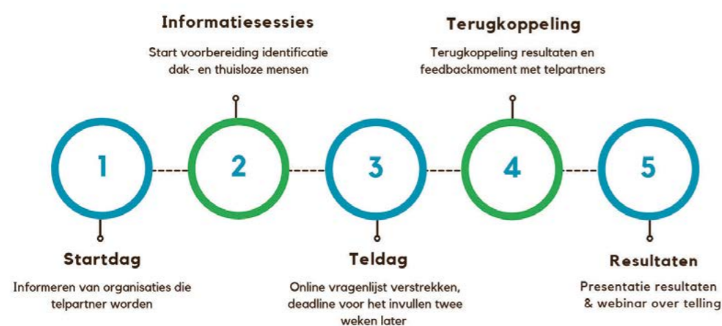
Figuur 3. Tijdlijn ETHOS-telonderzoek

In juli 2024 vond tijdens een feedbackmoment in Hoorn een terugkoppeling van de voorlopige resultaten van de telling plaats. Vertegenwoordigers van de deelnemende gemeenten, leden van de werkgroep en vertegenwoordigers van de belangrijkste telorganisaties waren hierbij aanwezig. Tijdens het feedbackmoment gingen de onderzoekers met deelnemers in gesprek over de telmethode en over het aantal mensen dat geteld is in verschillende leefsituaties in de verschillende gemeenten. Vanuit hun kennis van de situatie in de regio reflecteerden zij op de cijfers. Zo gingen we na of er voldoende geteld is en of de resultaten een juiste weergave zijn van de werkelijke situatie in de regio.