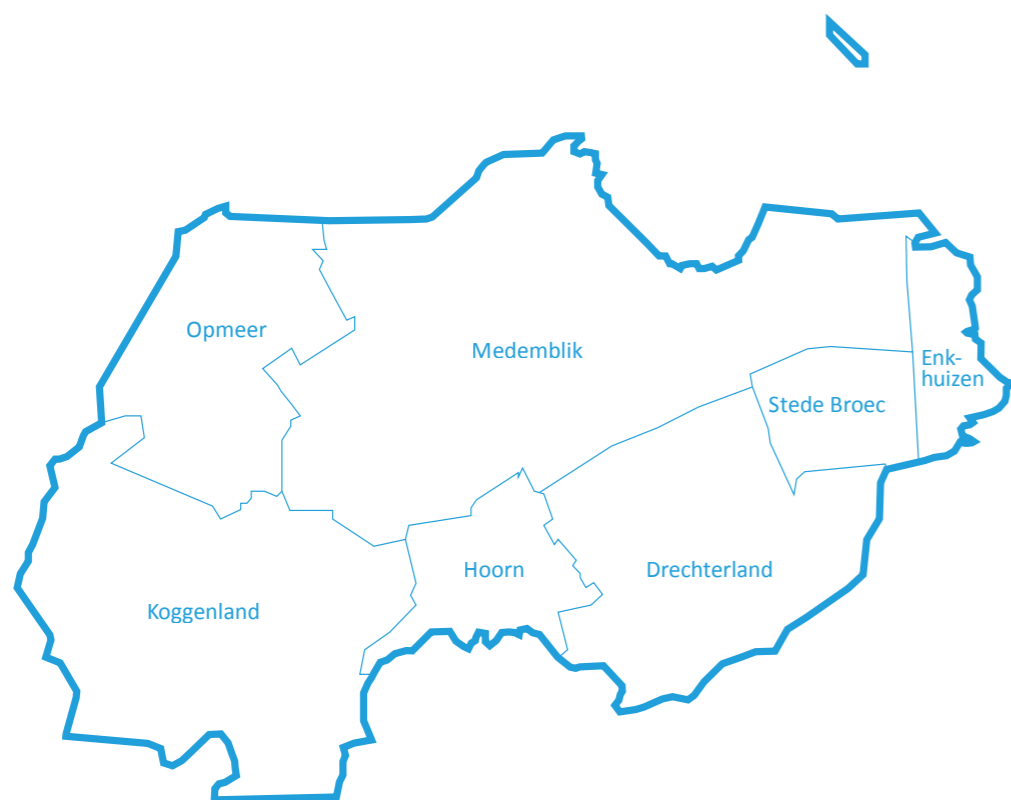
Figuur 2. Regiokaart West-Friesland

Er waren geen voorwaarden verbonden aan de duur van het verblijf in de regio: ook indien de persoon er één nacht verbleef, werd de persoon meegeteld. Er is steeds gekeken naar de actuele situatie van de persoon op de teldag. Alle personen die op de teldag voldeden aan de twee criteria werden meegeteld.